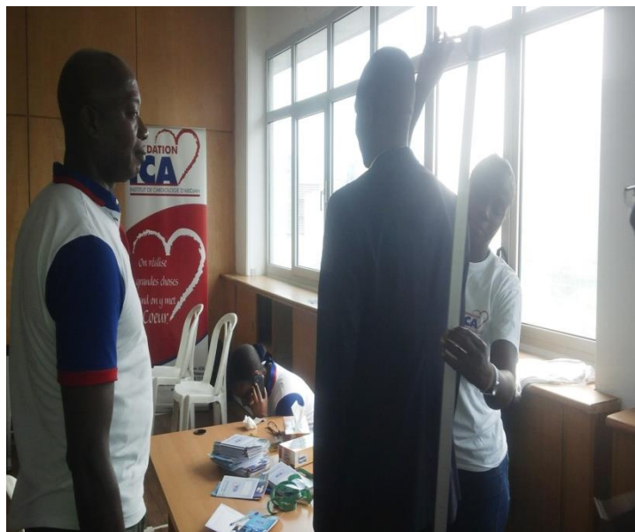
Prise des constantes : Poids, Périmètre Ombilical, Taille